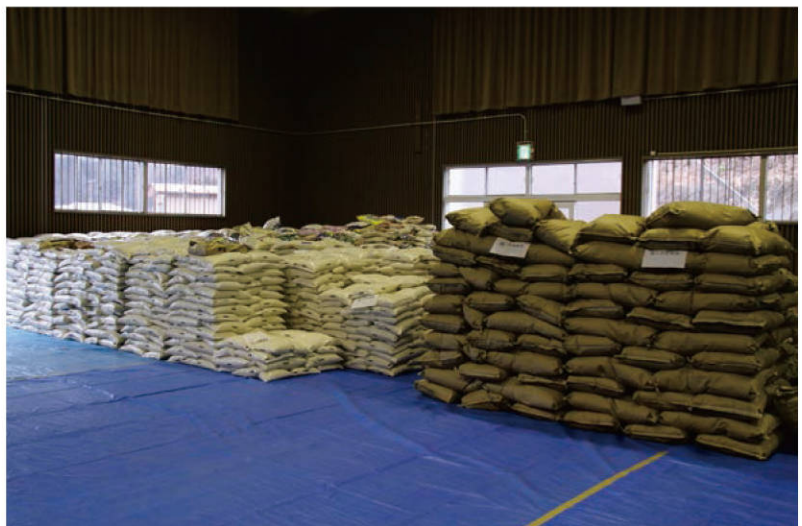
【支援物資が続々と送られてくる】