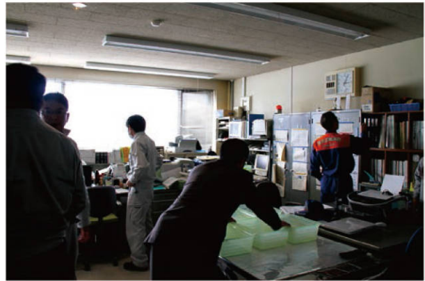
【地震直後の危機管理課室内の様子】