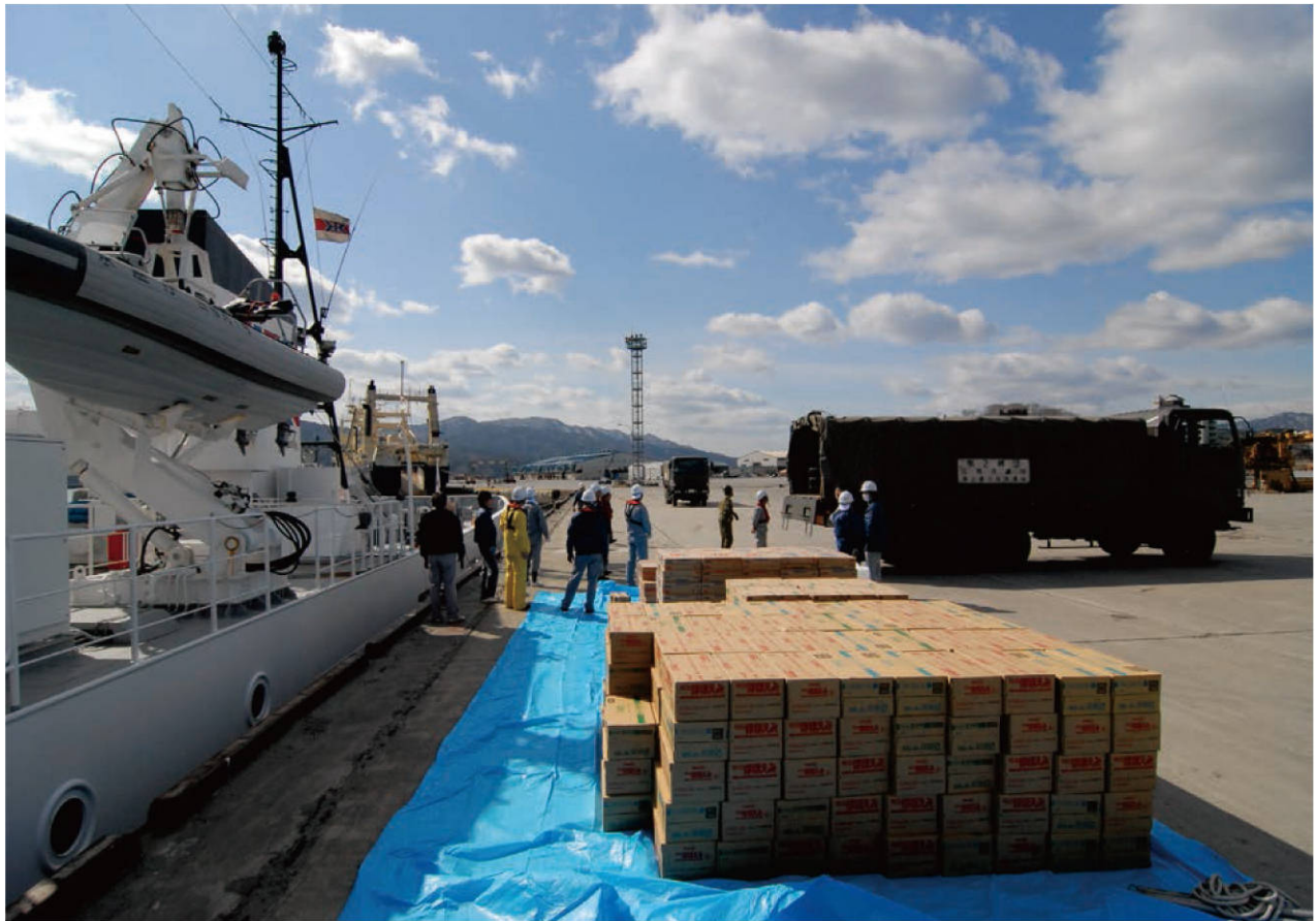
【大型輸送船により大量の物資が到着】