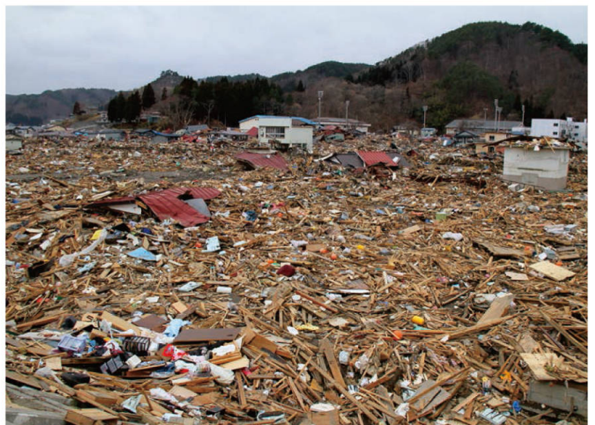
【災害発生後1週間後の田老地区の様子】