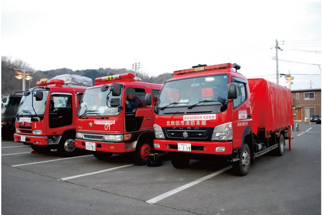
【レスキュー要請が増加し待機する緊急消防援助隊の消防車両】