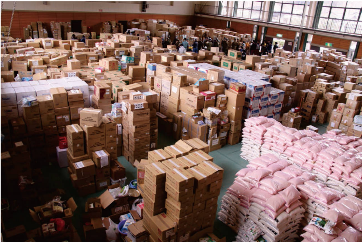
【新里トレーニングセンターへ大量の支援・物資が集積された】