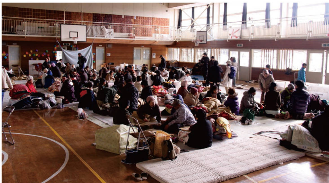
【発災直後の避難所の様子】