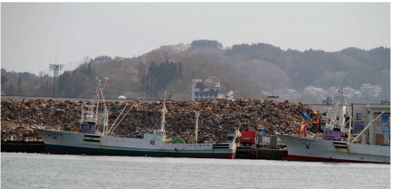
【出崎埠頭内には大量の瓦礫が積み上げられている】