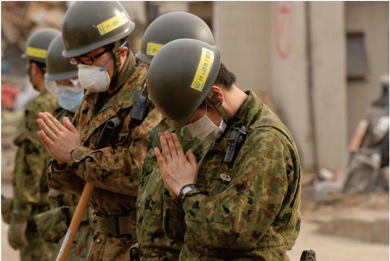
【遺体を発見し黙とうする自衛隊員。今後は、同じ災害が起こらないように願うばかりである】

□自衛隊等による重機での瓦礫除去の後始末として、細かい残材等の除去の依頼があるが、際限がないので行政の対応待ちとするよう回答している。危機管理監と協議済み（宮古社会福祉協議会）