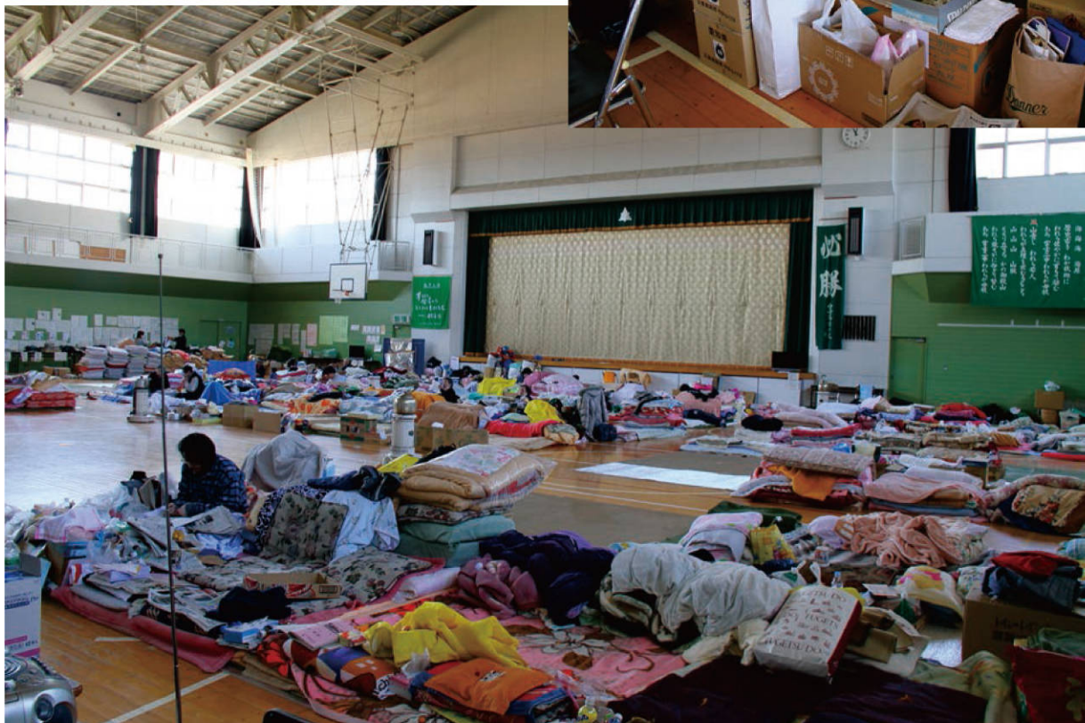
【震災後1か月後の避難所（第二中学校）】