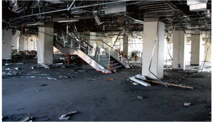
【シートピアなどの館内の被害の状況】