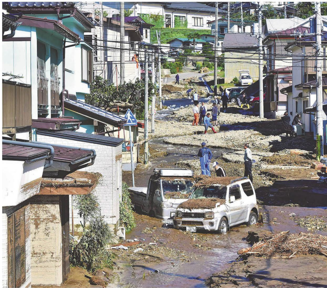
奥の山側から大量の土砂や水が流れ出て、住家や車が浸水した山田町船越の田の浜地区=13日午後1時すぎ