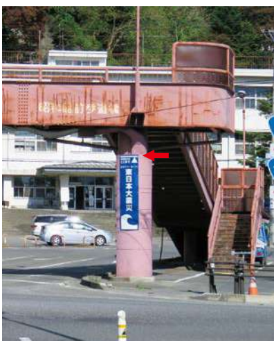
サイズ：2300 × 600mm 県届出高：2.3m