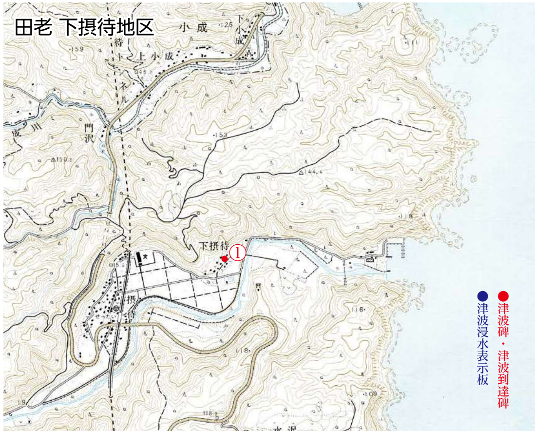
◆東日本大震災津波碑と津波浸水表示板 1 東日本大震災津波碑と津波浸水表示板位置図