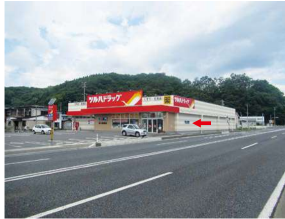
サイズ：600 × 2300mm 県届出高：2.0m