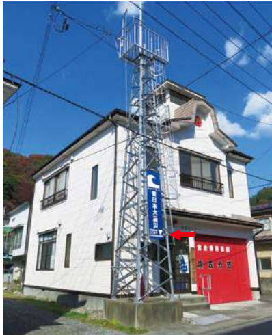
サイズ：2300 × 600mm 県届出高：2.0m