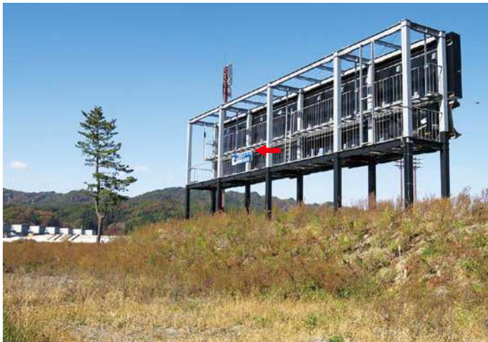
スコアボード裏：600 × 2300mm 県届出高：4.5m