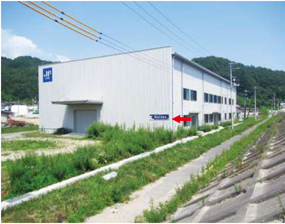
西側・(南側) サイズ：600 × 2300mm 県届出高：2.0m