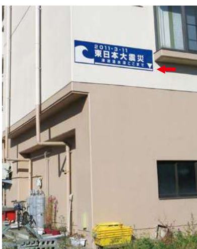
サイズ：600 × 2300mm 県届出高：3.2m