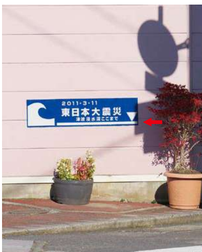
サイズ：600 × 1500mm 県届出高：0.9m