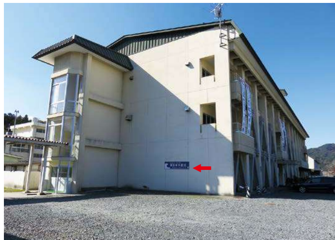
校舎側面（南側） サイズ：600 × 2300mm、県届出高：1.6m