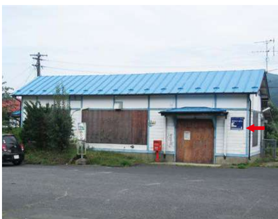
サイズ：600 × 600mm 県届出高：1.8m