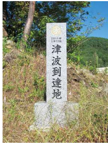
石碑：80.0 × 20.0 × 20.0cm 台座：20.0 × 40.0 × 40.0cm