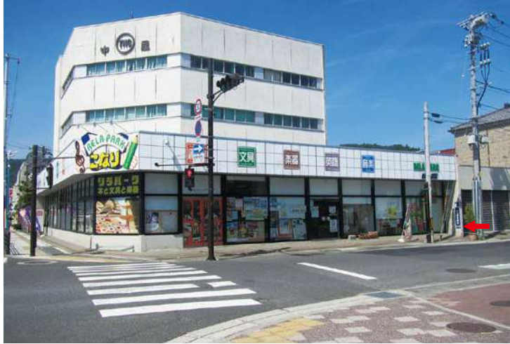
⑩ リラパークこなり