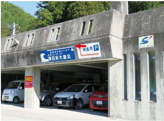
サイズ：600 × 2300mm 県届出高：3.8m