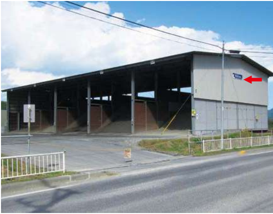
サイズ：600 × 2300mm 県届出高：6.0m