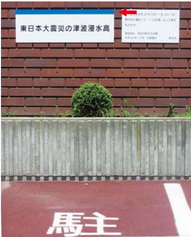
サイズ：400 × 1200mm 高さ：1.9m