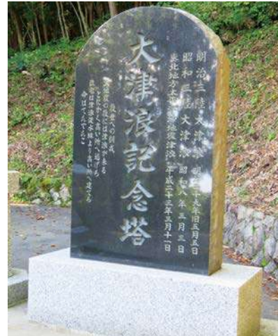
石碑：153.0 × 92.0 × 25.0cm 台座：41.0 × 133.5 × 55.0cm