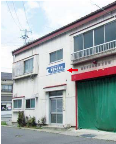
サイズ：600 × 2300mm 県届出高：3.2m