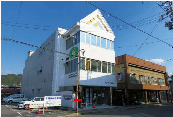
⑫ テレトラック宮古