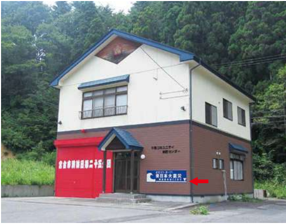
サイズ：600 × 2300mm 県届出高：1.0m