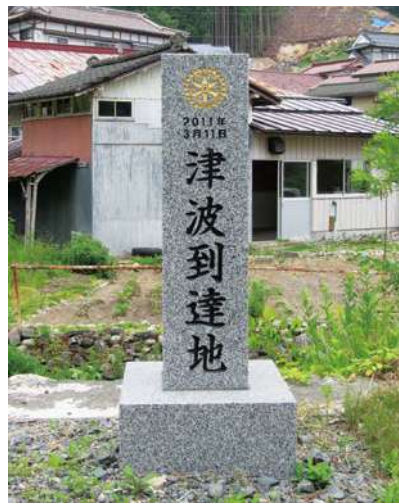
石碑：80.0 × 20.0 × 20.0cm 台座：20.0 × 40.0 × 40.0cm