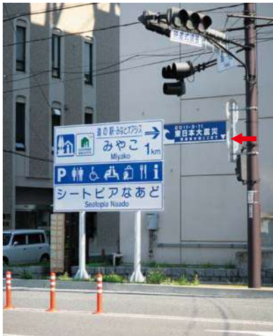
サイズ：600 × 2300mm 県届出高：3.2m