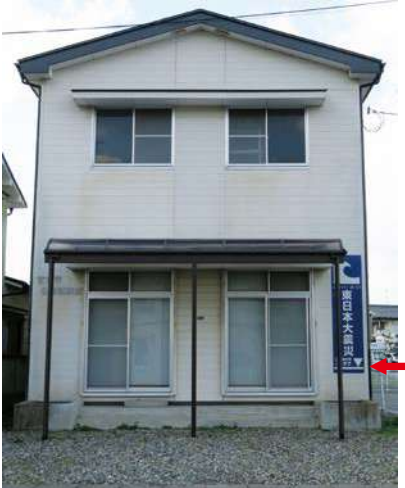
サイズ：2300 × 600mm 県届出高：1.2m