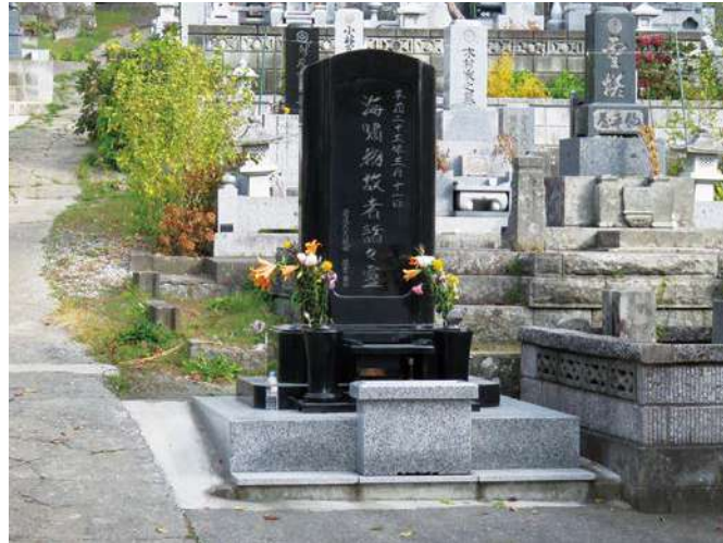
石碑：151.5 × 76.0 × 25.0cm 台座：27.0 × 105.0 × 53.0cm