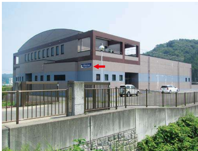
③ 田老浄化センター