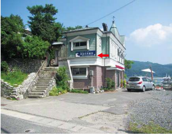
サイズ：600 × 2300mm 県届出高：2.1m