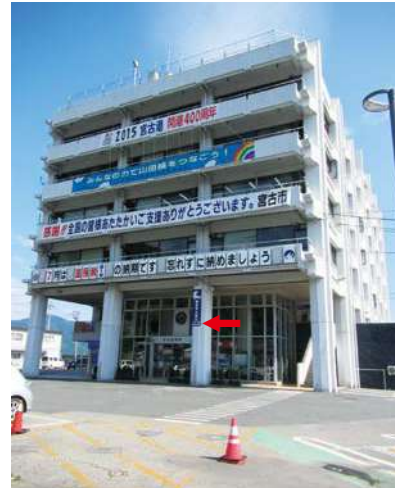
北側（正面玄関） 2300 × 600mm、3.5m