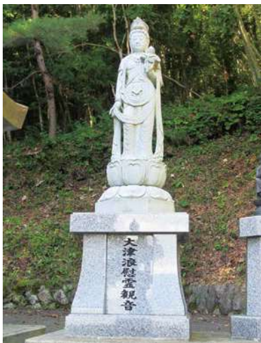
観音像：159.0 × 45.0 × 30.0cm 台座：93.5 × 91.0 × 91.0cm