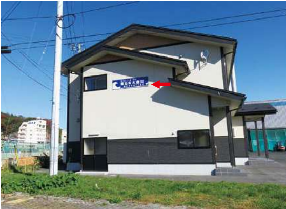
サイズ：600 × 2300mm 県届出高：5.0m