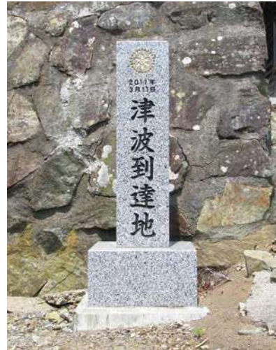
① 2 東日本大震災津波碑 津波到達地