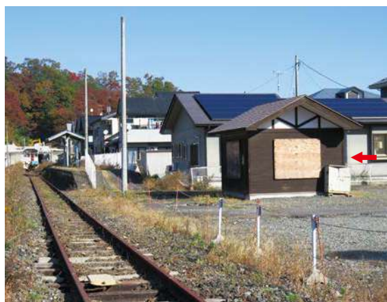
サイズ：600 × 600mm 県届出高：1.4m