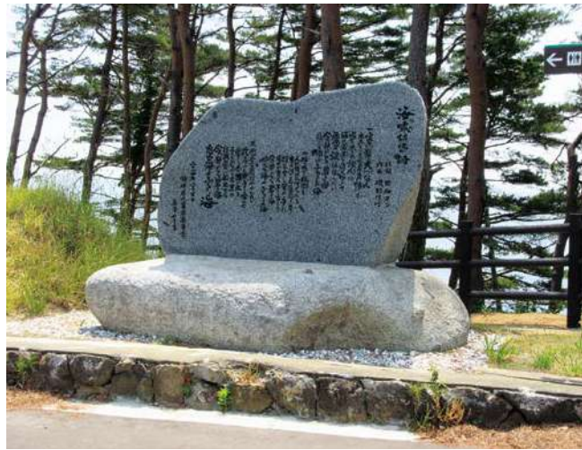
石碑：130.0 × 195.0 × 114.0cm 台座：51.0 × 294.0 × 239.0cm