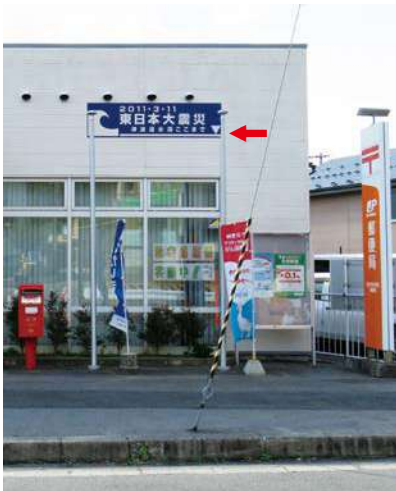
サイズ：600 × 2300mm 県届出高：3.2m