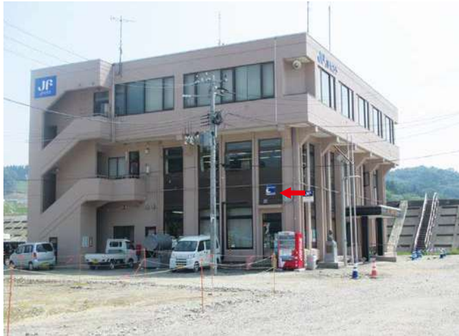
① 3 東日本大震災津波浸水表示板 田老漁業協同組合