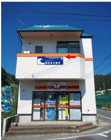
サイズ：600 × 1500mm 県届出高：2.5m