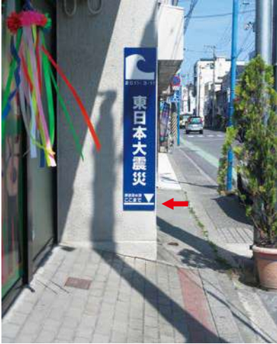
サイズ：1500 × 600mm 県届出高：0.6m