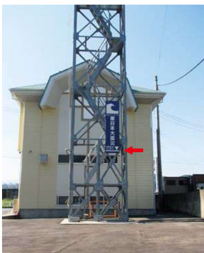
火の見櫓(国道側) サイズ：2300 × 600mm 県届出高：1.8m