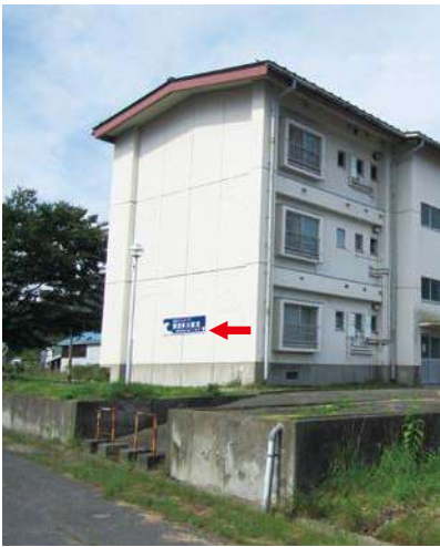
サイズ：600 × 2300mm 県届出高：2.0m