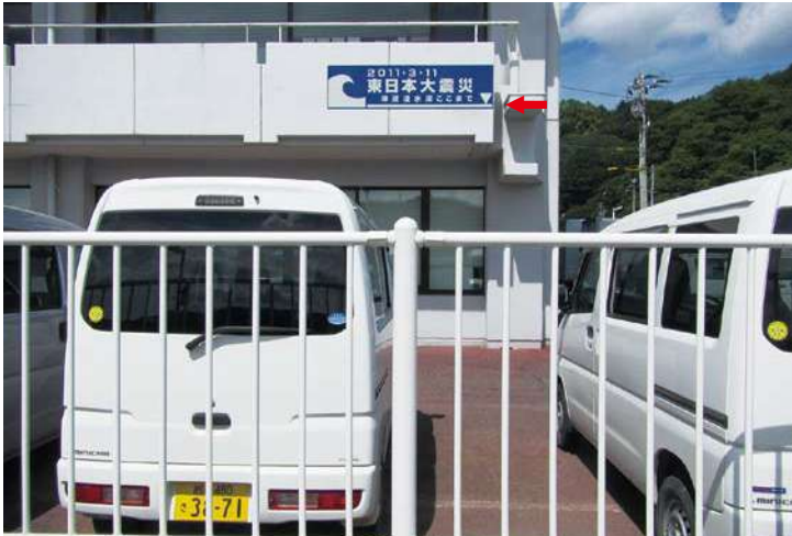
南側（国道側）サイズ：600 × 2300mm 県届出高：3.5m