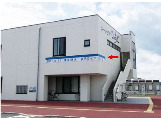
(北側) 600 × 6200mm (西側) 600 × 2450mm 高さ：5.0m