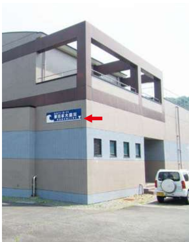
サイズ：600 × 2300mm 県届出高：2.0m