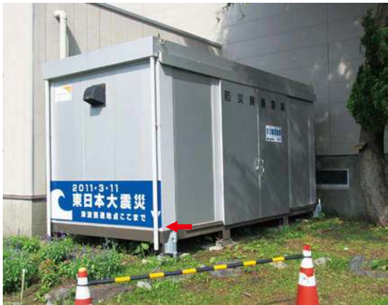
防災備蓄倉庫側面 サイズ：600 × 2300mm 県届出高：0.1m