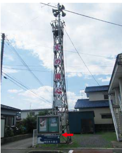
サイズ：600 × 2300mm 県届出高：0.9m