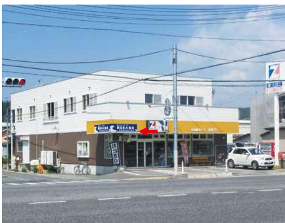
サイズ：600 × 2300mm 県届出高：2.1m