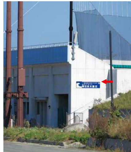
一塁スタンド西側：600 × 2300mm 県届出高：3.5m