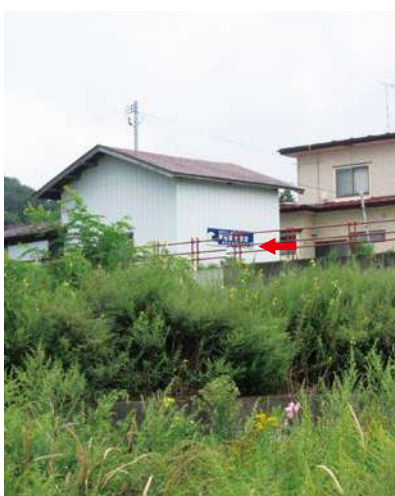
サイズ：600 × 2300mm 県届出高：1.8m