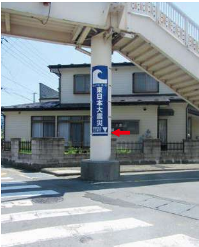
サイズ：2300 × 600mm 県届出高：1.1m