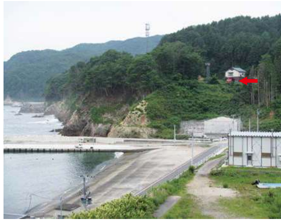
④9 宮古市消防団第二十五分団屯所