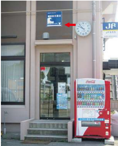
サイズ：600 × 600mm 県届出高：4.0m