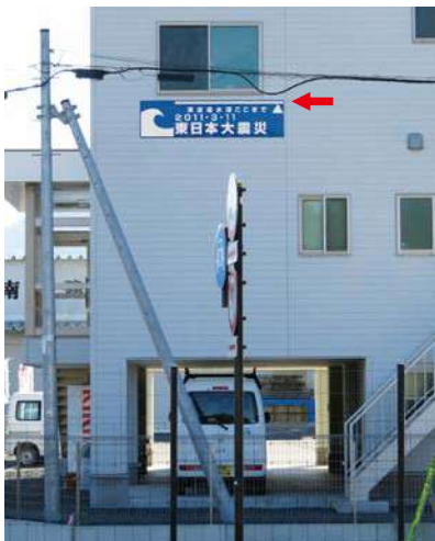
サイズ：600 × 2300mm 県届出高：5.5m