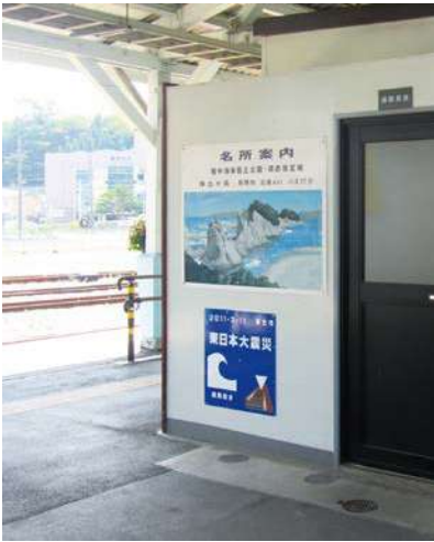
サイズ：600 × 600mm 県届出高：軌道冠水