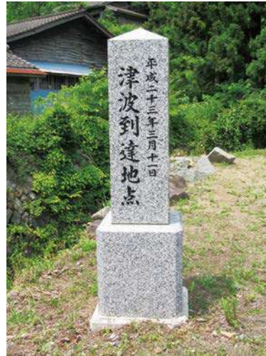
石碑：82.0 × 24.5 × 24.5cm 台座：39.0 × 37.0 × 37.0cm