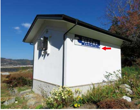
サイズ：600 × 2300mm 県届出高：2.1m