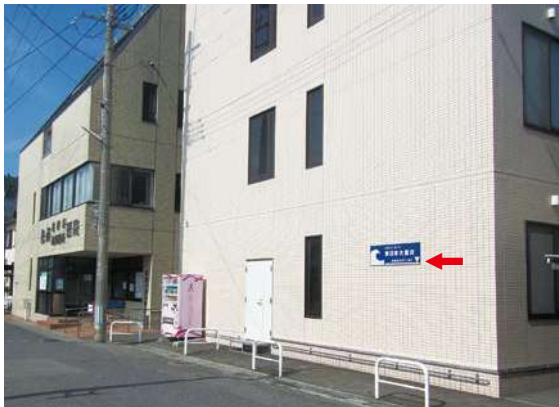
サイズ：300 × 1200mm 県届出高：1.8m