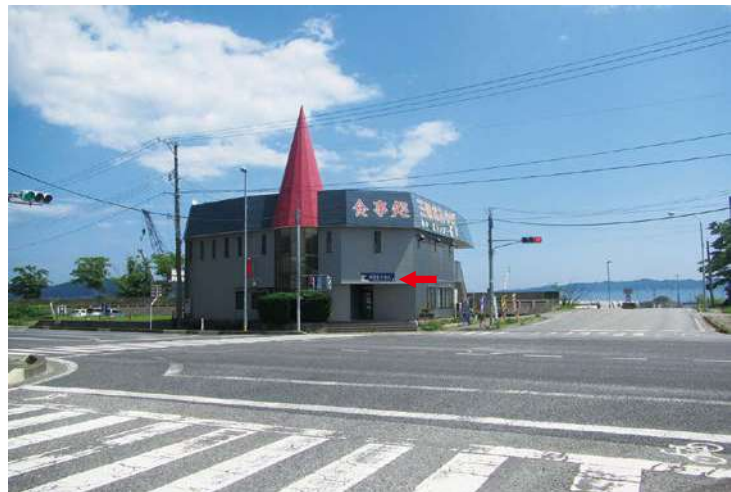
サイズ：600 × 2300mm 県届出高：2.5m