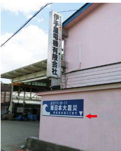
サイズ：600 × 2300mm 県届出高：1.6m