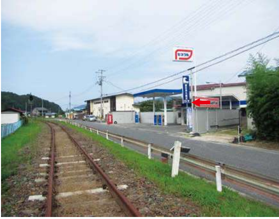
サイズ：2300 × 600mm 県届出高：2.1m