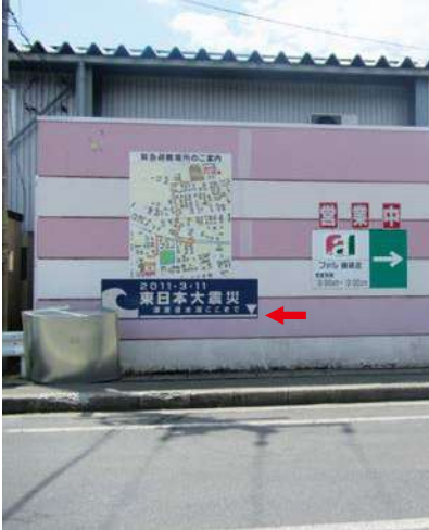
サイズ：600 × 2300mm 県届出高：1.5m