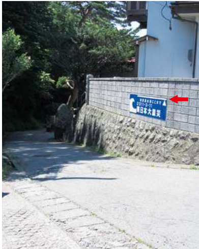
サイズ：600 × 2300mm 県届出高：1.8m