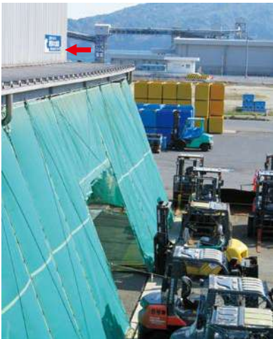
サイズ：600 × 2300mm 県届出高：5.0m