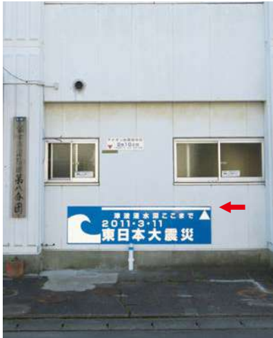
サイズ：600 × 2300mm 県届出高：1.0m