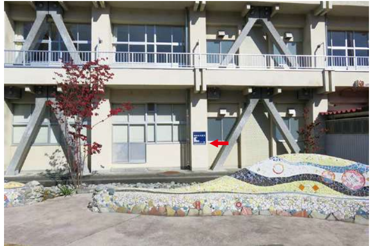
校舎中庭（西側） サイズ：600 × 600mm、県届出高：1.2m