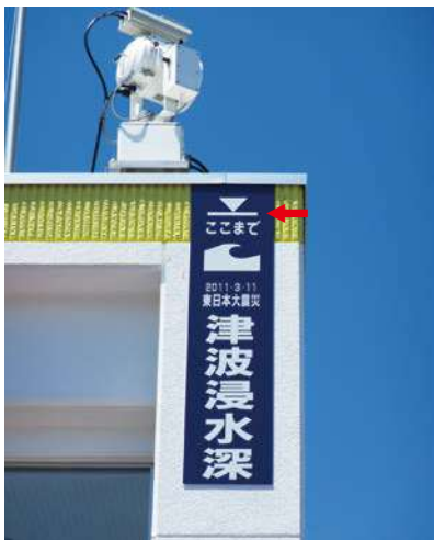
サイズ：2300 × 600mm 高さ：11.2m