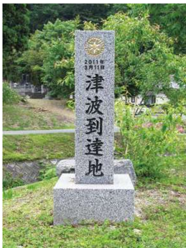
石碑：80.0 × 20.0 × 20.0cm 台座：20.0 × 40.0 × 40.0cm