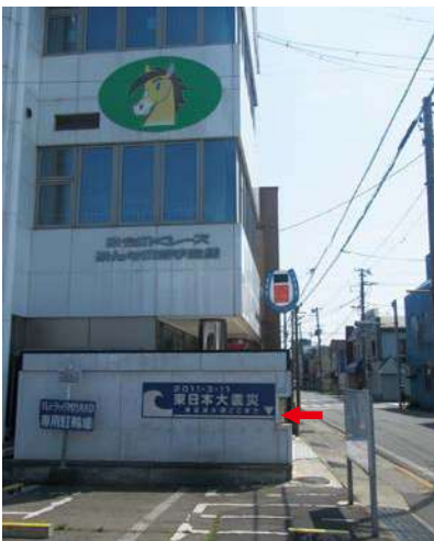
サイズ：600 × 2300mm 県届出高：1.2m