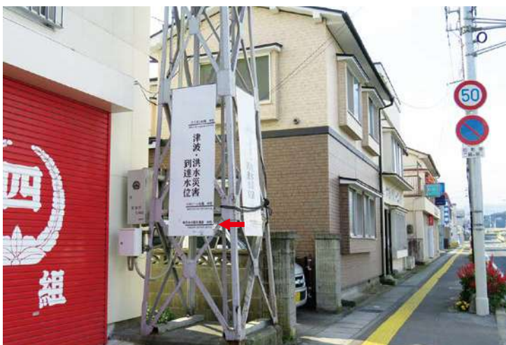
サイズ：1820 × 600mm 高さ：1.4m