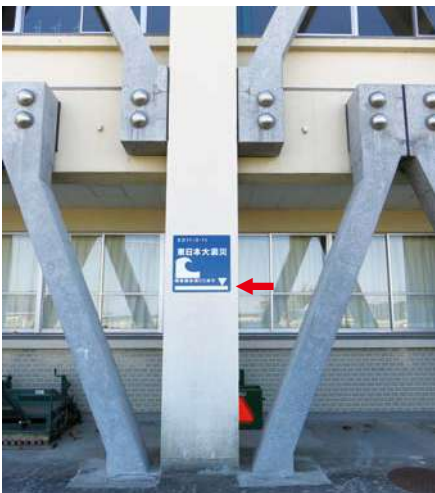
校舎正面（東側） サイズ：600 × 600mm、県届出高：1.6m