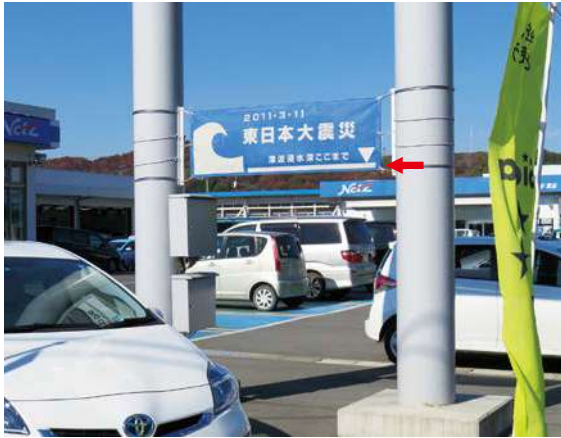
サイズ：600 × 2300mm 県届出高：1.8m