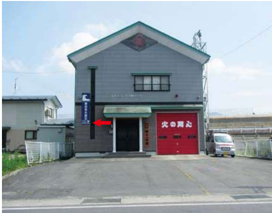
サイズ：2300 × 600mm 県届出高：2.2m